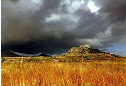
Tiefe Wolken über den südlichen Ausläufern des Taygetosgebirges

Die Mani, geprägt vom bis zu 2.400 Meter hohen Taygetos -Gebirge und dessen südlichsten Ausläufern, war bis ins 20. Jahrhundert wegen ihrer Unwegsbarkeit Rückzugsgebiet für viele Menschen auf der Flucht vor fremden Eroberern und aus dem gleichen Grund auch ideal für Piraten . Durch die besondere Topographie war die Mani ein Landstrich fast frei von staatlichen Eingriffen und entwickelte einen besonderen Menschenschlag mit eigener Kulturform. Obwohl es an befestigten Orten schon viel früher einzelne Kirchen gab, fasste das Christentum erst im neunten Jahrhundert richtig Fuß, als unzählige Kirchen und Kirchlein gebaut und mit teils noch heute wunderschönen Fresken geschmückt wurden.