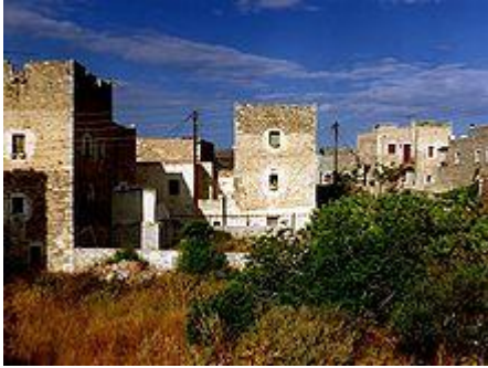
Wohntürme auf der Mani