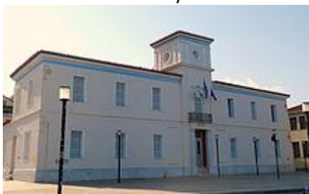
Rathaus, entworfen von Ernst Ziller