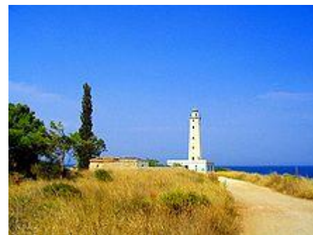
Leuchtturm auf Marathonisi

Marathonisi ( griechisch Μαραθονήσι) oder Kranai ( griechisch Κρανάη, lateinisch Cranae ) ist eine kleine Insel südöstlich von Gythio . Die vorgelagerte Insel mit einem Pinienwäldchen und einem Leuchtturm grenzt die Hafenstadt malerisch gegen das offene Meer hin ab.