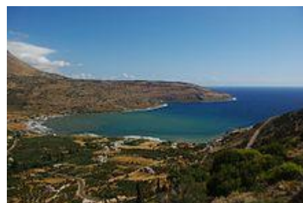
Küstenabschnitt in der Gemeinde – die Limeni-Bucht bei Areopoli