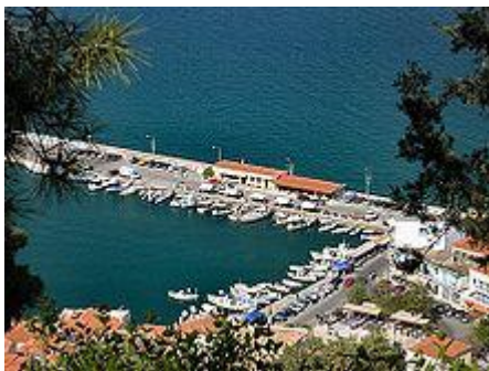
Blick auf den Hafen von Gythio

Erst als sich ab Ende des 18. Jahrhunderts die einflussreiche Familie der "Grigorakis" hier niederließ, wurde der Ort neu besiedelt und erlebte neue Blüte, bis er im Zuge der Landflucht im 20. Jahrhundert wieder abmagerte.