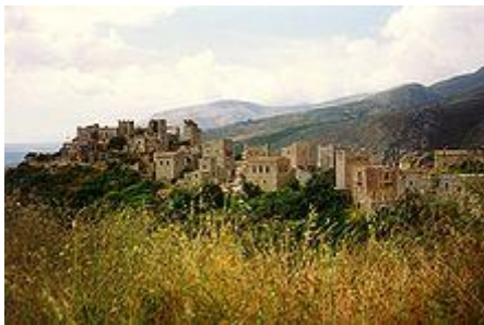
Das Dorf Vathia im Süden Anatoliki Mani

Mani wird unterteilt in drei Bereiche: die äußere Mani ( Éxo Mani ) nördlich von Areópoli, die hauptsächlich in der nordwestlich gelegenen Präfektur Messenien liegt, die innere Mani ( Méssa Mani ) südlich von Areópoli auf der westlichen Seite, sowie die Östliche Mani ( Kato Mani ) mit dem Hauptort Gythio , die letzten beiden Teile liegen in der südöstlichen Präfektur Lakonien .